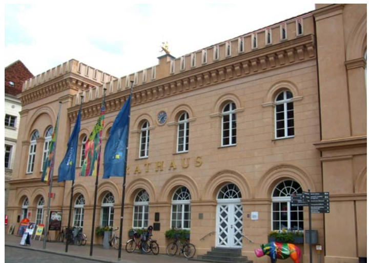
Tagungsstätte der Schweriner Stadtvertretung: Das Rathaus