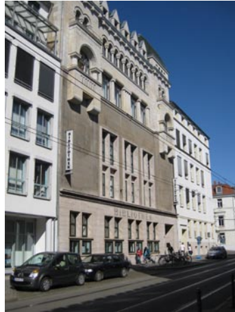
Wismarsche Straße 144

In den 1950-er Jahren wurden die straßenseitige Fassade an der Wismarschen Straße überformt