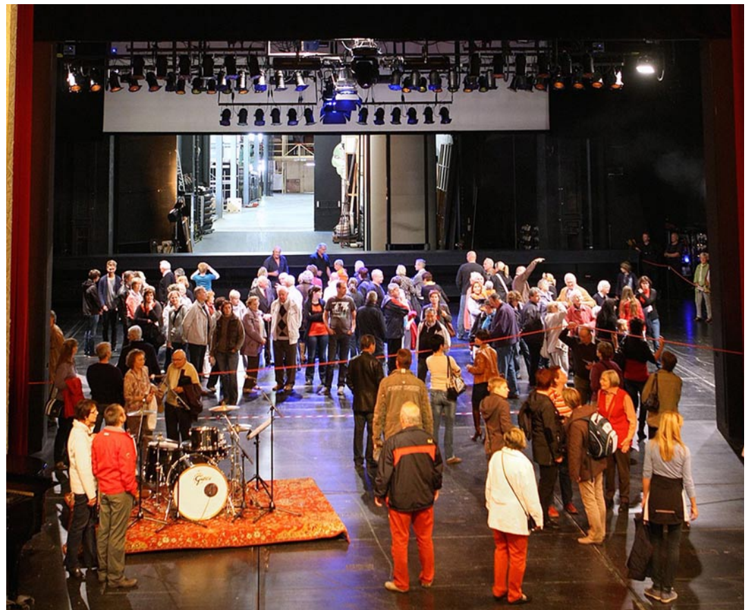
Hinter die Kulissen des Mecklenburgischen Staatstheaters geschaut.

In der Aula der Volkshochschule lädt das Stadtarchiv wieder zur Archivfilmnacht ein. Dabei ist neben Filmdokumenten aus der Stadtgeschichte auch ein 1921 in Schwerin gedrehter Spielfilm zu sehen. Galerien, Kunsthäuser und Kunstvereine präsentieren Ausstellungen, die von Fotografie über Malerei bis hin zu unterschiedlichsten künstlerischen Techniken und Themen reichen. Künstlerinnen und Künstler stellen ihre Arbeiten vor, öffnen ihre Ateliers und suchen den Dialog mit dem Publikum. Während im „Kunst-Wasser-Werk“ oder in der Galerie des M-V Foto e. V. die aktuellen Ausstellungen an diesem Abend letztmalig zu sehen sind, gibt es anderenorts Ausstellungseröffnungen. Das Schleswig-Holstein-Haus zeigt in seiner neuen Schau Kunst aus Växjö, und die Stiftung Mecklenburg lässt die Gäste am Entstehen eines virtuellen Landesmuseums teilhaben. Mit „Foto (und) Kunst III“ präsentieren sich in der „gallery berger“ 18 Künstlerinnen und Künstler aus Mecklenburg-Vorpommern mit ihren