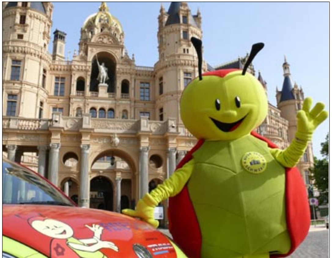
Ihn haben die Schwerinerinnen und Schweriner ins Herz geschlossen: BUGA-Maskottchen Fiete