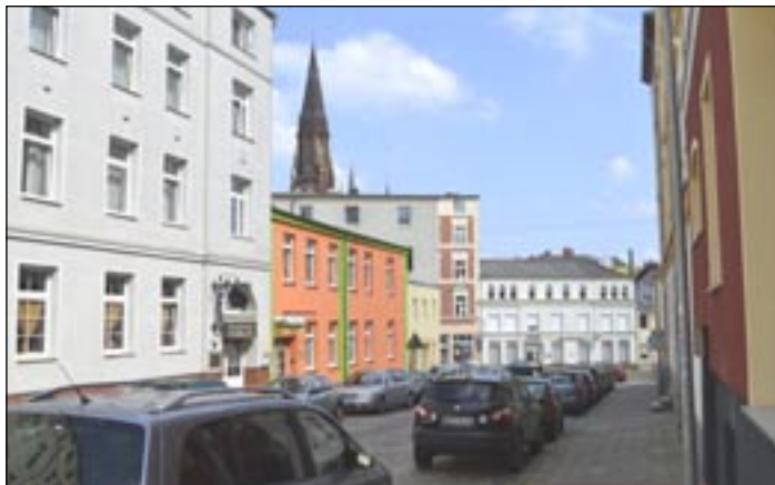
Die „Mittlere Paulsstadt“ wird ab 14. September als Bewohnerparkzone H ausgewiesen.

„Die Bewohnerparkzone dient insbesondere dem Schutz der Bewohner vor den Belastungen eines übermäßigen Parksuchverkehrs. Das Bewohnerparkvorrecht können alle Bewohnerinnen und Bewohner in Anspruch nehmen, die in diesem Bereich meldebehördlich registriert sind und dort tatsächlich wohnen. Keinen Anspruch auf einen Parkausweis haben Bewohner, die in diesem Bereich oder in unmittelbarer Nähe über einen privaten Stellplatz oder eine Garage verfügen“, erläutert