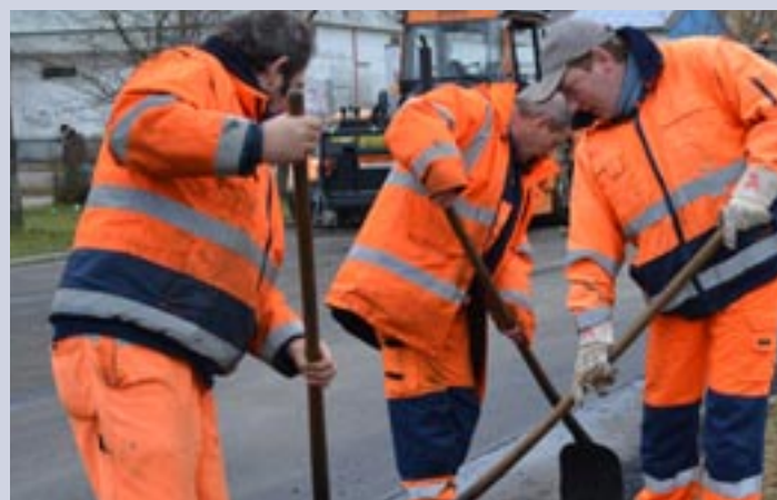
Mit Hilfe des Landesprogramms sollen Straßenschäden behoben werden.

dabei auf die Instandsetzung von insgesamt 11.400 Quadratmetern Straßenfläche auf dem Obotritenring.