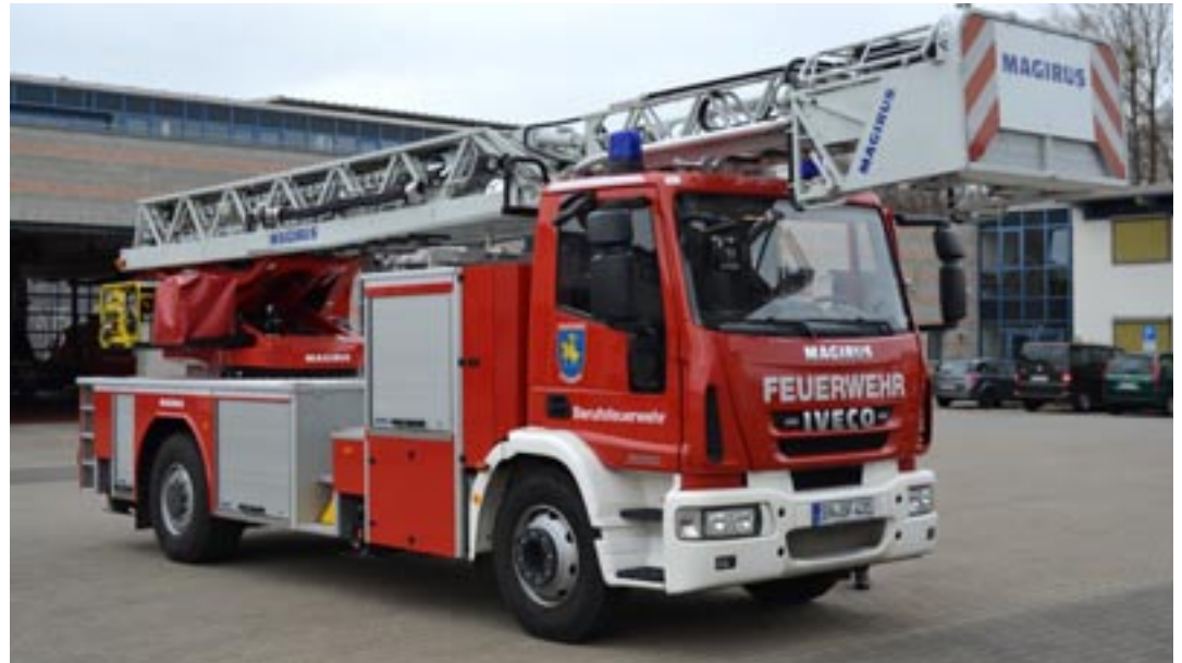
Ab sofort im Einsatz bei der Schweriner Berufsfeuerwehr: Das neue Drehleiterfahrzeug.

Sie ist optimal auf Einsatzbedingungen der Berufsfeuerwehr Schwerin mit den beengten Einsatzstellen im Stadtgebiet, insbesondere im Alt-