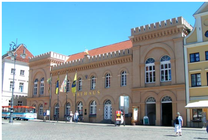
Im Demmlersaal des Rathauses tagen die Stadtvertreterinnen und Stadtvertreter

Für die Wahl der Stadtvertreter der Landeshauptstadt Schwerin am 7. Juni 2009 hat der Wahlausschuss in seiner Sitzung am 8. April 2009 nachfolgende Wahlvorschläge zugelassen: