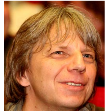
Andreas Dresen

Zwei Preisträger stehen bereits jetzt fest: Der Kameramann Michael Ballhaus ist Ehrengast des Festivals und wird mit dem „Goldenen Ochsen“ ausgezeichnet. Der vielfach preisgekrönte gebürtige Berliner arbeitet vorwiegend in Hollywood und drehte unter anderem Filme wie „Departed“, „Gangs of New York“ und „Outbreak: Lautlose Killer“. Der in Schwerin aufgewachsene Regisseur Andreas Dresen kann sich ebenfalls über eine Auszeichnung freuen. Der 45-Jährige erhält den Film- und Medienpreis der Landeshauptstadt. Bei der feierlichen Eröffnung des Filmkunstfestes am